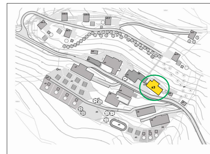
Objekt a3 v naselju Sonce