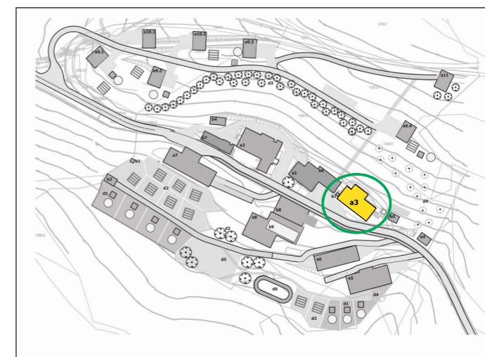
Objekt a3 (851-1150) v naselju Sonce