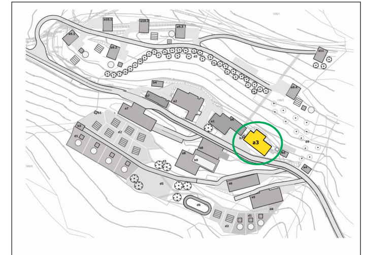
Objekt a3 (851-1150) v naselju Sonce