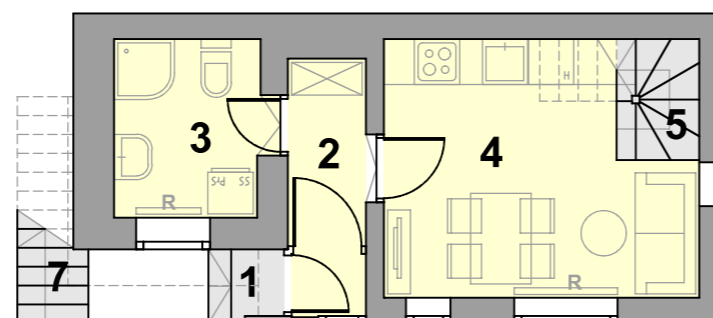
Pritličje M 1:100